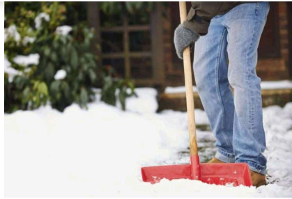
Winterdienst: Räum- und Streupflicht für Mieter und Vermieter