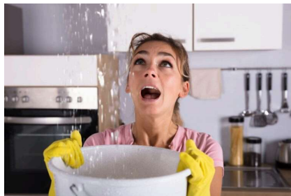
Unverschuldeter Wasserschaden in der Mietwohnung – Rechte des Mieters