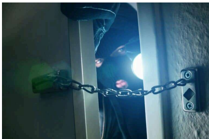
Einbruchschutz in der Mietwohnung nachrüsten