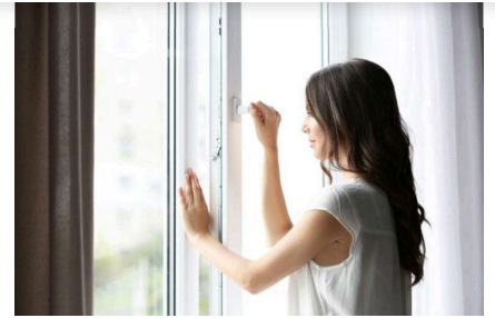
Wohnung richtig lüften und heizen