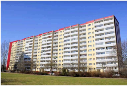
Wohnberechtigungsschein für Sozialwohnung